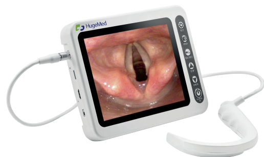
Laringoskopi za enkratno uporabo