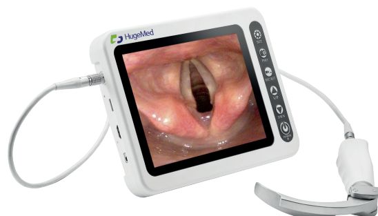
Laringoskopi za večkratno uporabo